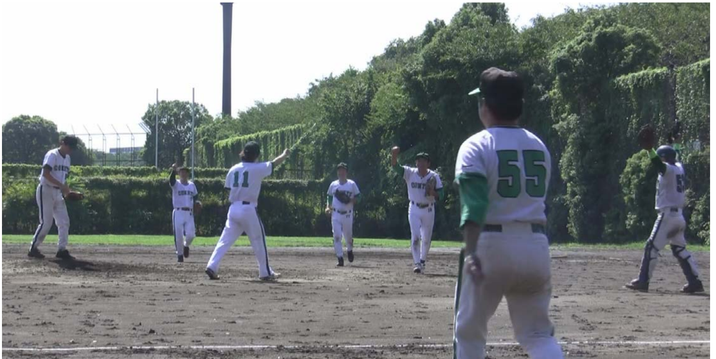
最後の打者を内野ゴロに討ち取ってゲームセット！ ジュニアリーグ優勝を決め喜びに沸くJCナイン

また、その後行われたジュニアリーグ紅白戦に来期からの入会を希望する新人選手8名が参加。いずれ劣らぬ好選手揃いで来シーズンの公式戦が今から楽しみになってきました！