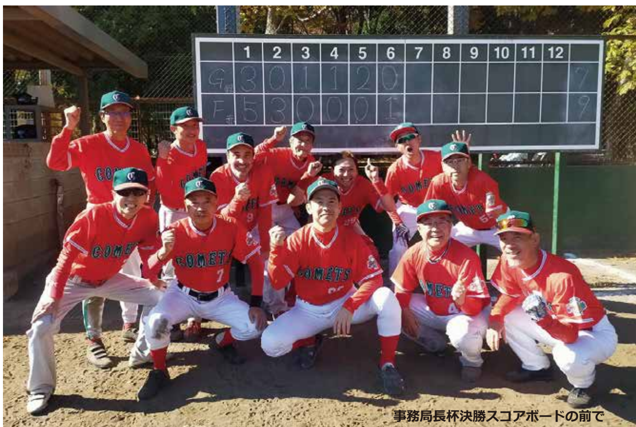
事務局長杯決勝スコアボードの前で

最後に、事務局長杯というシーズン終盤の素晴らしい企画を実施していただいたコメッツ関係者の皆様にも深く感謝申し上げます。ややもすると消化試合になりがちなシーズン終盤が、とても充実していました。ありがとうございました！！